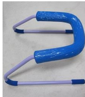
姿勢保持をするための器具