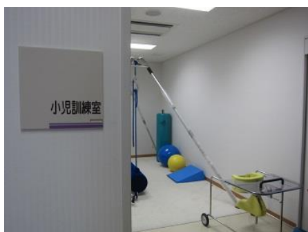
小児訓練室の入口

小児訓練室では主に、小児分野の患者様が外来通院でリハビリテーションを実施しています。また必要に応じて小児訓練室ではなく、機能訓練室へ移動し練習も行うこともあります。